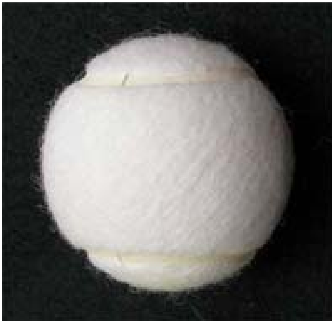
Pelota de tenis tradicional del siglo XX